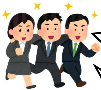
第11期岡山県生涯学習審議会 及び岡山県社会教育委員の会議