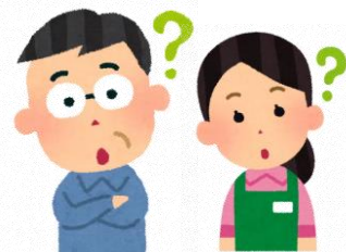
熟議未経験の地域の方