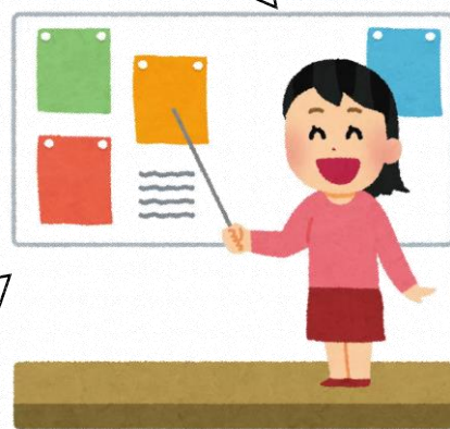
瀬戸内市立美和小学校の児童