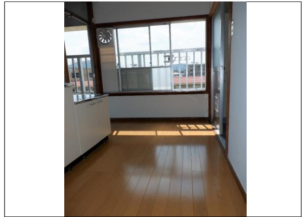
DK (玄関→バルコニー側の角度)