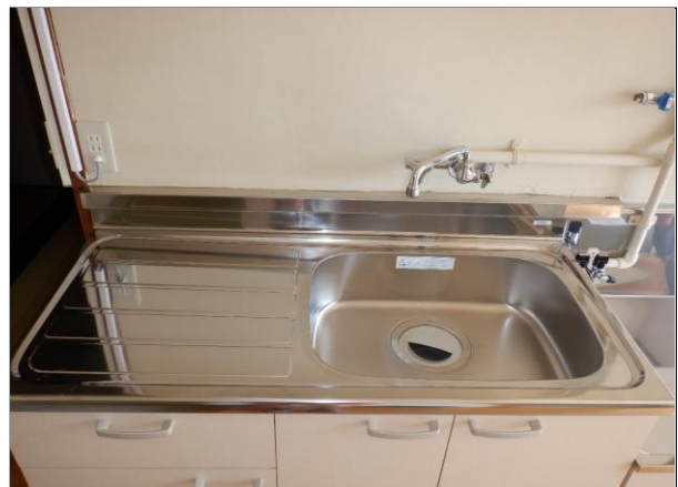
ガスコンロ置き場