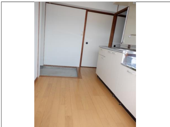
DK (バルコニー→玄関側の角度)