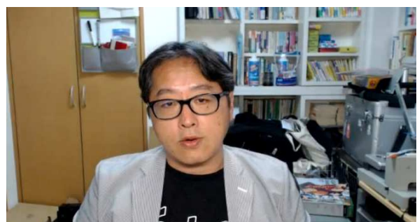
第3回キャリアアップ講座