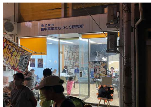
備中松山踊り（8月14日～16日）の開催中、クラブを休憩所として開放