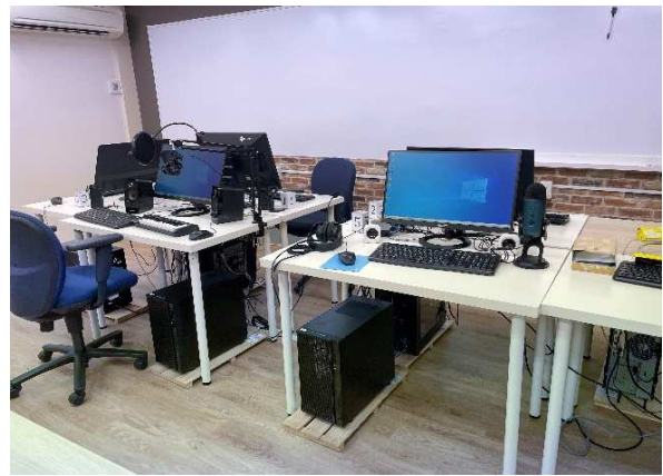
パソコンコーナー