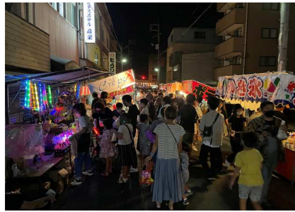
備中松山踊りに参加