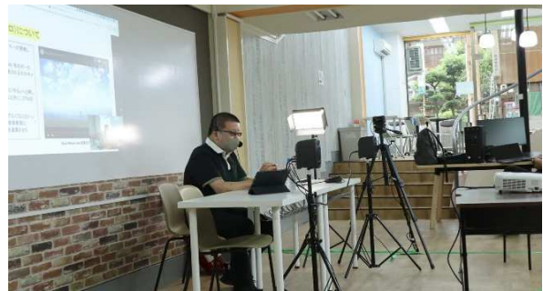
第1回キャリアアップ講座