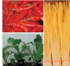
県特産物の機能的な優位性の探索