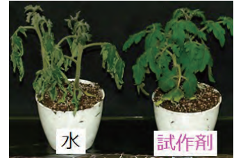
環境ストレスを緩和するバイオスティミュラントの開発