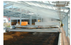
スクープ式堆肥舎