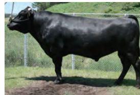
優良種雄牛の改良・和牛精液の供給