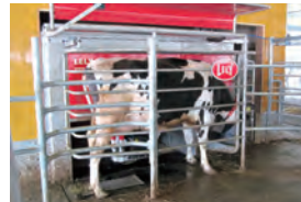
搾乳ロボットによる精密飼養管理