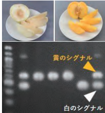
果肉色の予測による効率的モモ新品種育成法の開発