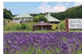
まきばの館・ラベンダー