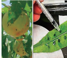
モモせん孔細菌病抵抗性の判定による防除技術の開発