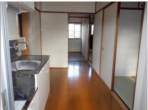
DK (バルコニー→和室側の角度)