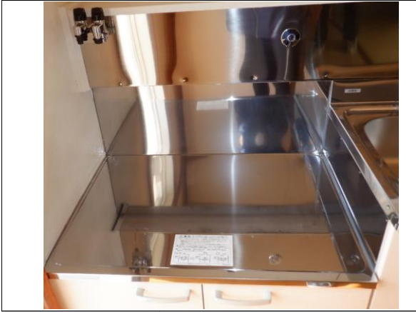
ガスコンロ置き場