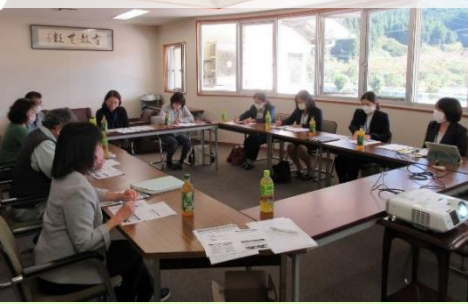
奥津小学校・富小学校 管理職、公民館長、地域学校協働活動推進員

学校は、地域住民の参画を得て、 地域人材の活躍 や 地域資源の活用 を意識しながら『 地域とともにある学校づくり 』を行います。また、地域は、学校と情報交換しながら、地域全体で子ども達の成長を支えるため、共に取り組み、長期的な視点に立ち、『 学校を核とした地域づくり 』へと活動を広げていきます。まずは「 地域と学校が共に学び、考える 」第一歩を踏み出しています。