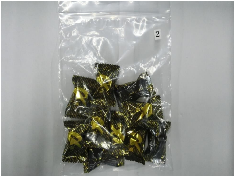
威力キャンディー