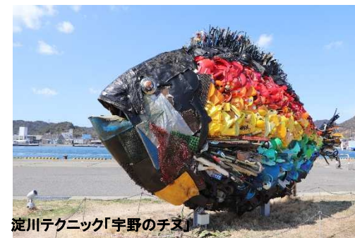
淀川テクニック「宇野のチヌ」