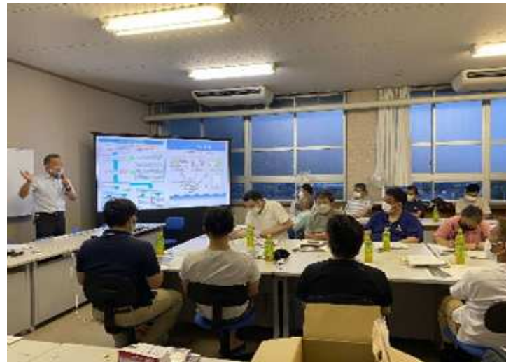
広木地区自主防災会