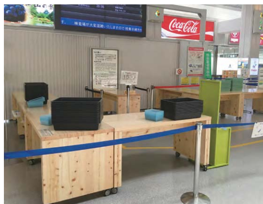
＜団体案内カウンター＞