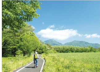
蒜山高原サイクリング