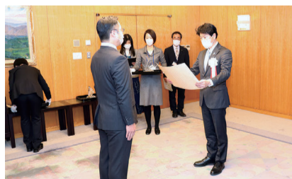
令和4年度 授賞式の様子

経営革新制度の普及啓発と事業者の取り組み意欲の向上を図るため、他の模範となる事業者を表彰する「岡山県経営革新アワード」を毎年開催しています。令和4年(2022年)に経営革新計画が終了した事業者の中から、取り組み内容や計画の実施状況、付加価値額の伸び率などを審査し、今年度の受賞事業者を決定しました。