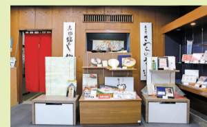
志ほや 岡山本店の店内

弊社は贈答品を加工・製造・販売している老舗の進物店です。約20年前にECサイトを開設しましたが、戦略的な運営ができておらず、売上が伸び悩んでいました。そんな中、岡山県プロフェッショナル人材戦略拠点から「副業・兼業人材」の起用を提案されました。人材紹介会社も、すぐさま弊社が抱える悩みに応じた複数の人材を候補として挙げてくれた上、初めての「副業・兼業人材」を活用する弊社をサポートしてくれました。オンライン面接の末に、効果的なECサイトの運営方法とメルマガ制作、それぞれに精通した県外の方2名を採用。こちらの要望に対して、オンラインで柔軟に対応してくださいました。おかげさまで、ECサイトの売上は着実に向上。メルマガの開封率も上がりました。