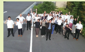
若手・女性が多く活躍する岡山本社

河川、水中心点検における従来のやり方は、手間がかかると同時に危険なものでした。地域の防災力向上にも直結するものですから、我が社の強みを活かし、ICTを活用した新たな点検システムの開発・提供を計画しました。計画を立てる際は、岡山県産業振興財団からの確かな助言や中小企業診断士を紹介してもらうなど、さまざまな支援があり、計画策定を通じてアイデアを形にすることが出来ました。計画が承認されお墨付きを得られたのは自信につながり、社内のモチベーションも高まりました。その結果、計画を申請して5年間で売上が3倍に。また、挑戦心の旺盛な若い社員が集まるようになり、今では20代～30代前半の社員が全社員の半数以上を占めています。