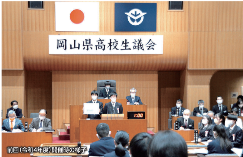
前回(令和4年度)開催時の様子

12/19(火)に、本会議場で高校生議会を開催します。次代を担う高校生と議長、副議長、各委員会委員長が県政の課題について議論を交わします。 当日の傍聴はできませんが、議会HPでライブ中継をするほか、後日、録画配信します。詳細は、議会HPに掲載しますので、ご覧ください。