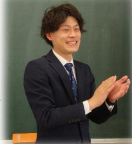
瀬戸内市立邑久小学校 教諭