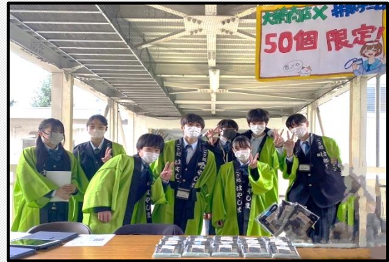
はやしまの日～早島町魅力アップ大作戦～

小学生の夏休み中の体験活動を地域や大学生がスタッフとして支える「わくわくサマーホリデー」、中学生が高校生、大学生と共に実行委員として参加・運営し、開発した商品を販売する「花ござピンポン世界大会」、留学生を講師に迎え、実践的なレッスンを行う「土曜英会話塾」、大人や大学生と夢や生き方について語り合う「中学生だっぴ」等を開催するなど、早島の未来を担う、たくましい早島っ子を育てていくために、学校と家庭と地域の皆さんとが手をつなぎ、地域が一体となって、未来に生きる社会人を育てていきたいと思っています。