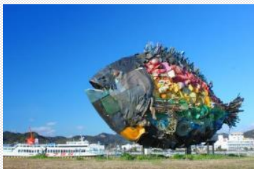
宇野のチヌ/淀川テクニク