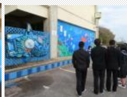
<小学生による職業体験> <豊かな海を守る取組>