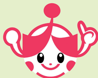
岡山県人権啓発シンボルマーク

こうした書き込みによって、憤りを感じたり傷付いたり悲しんだりする人がいることを十分にわきまえ、利用者一人ひとりがモラルを守り、インターネットを正しく利用しましょう。