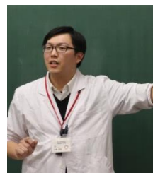
西栗倉村立 西栗倉中学校 教諭

西栗倉村は自然豊かで、伸び伸びとした教育を行うことができます。皆さんとともに働ける日々を楽しみにしています。