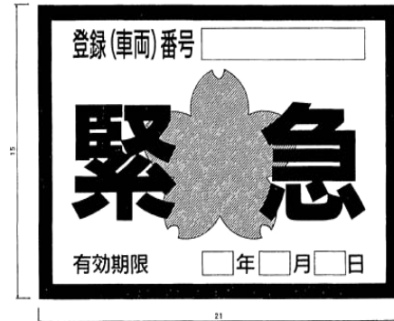
別記様式第7(第6条の2関係)