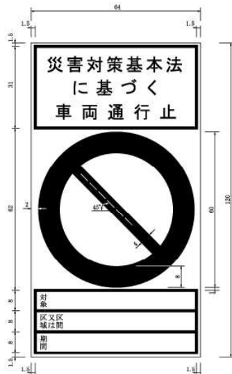
別記様式第2（第5条関係）