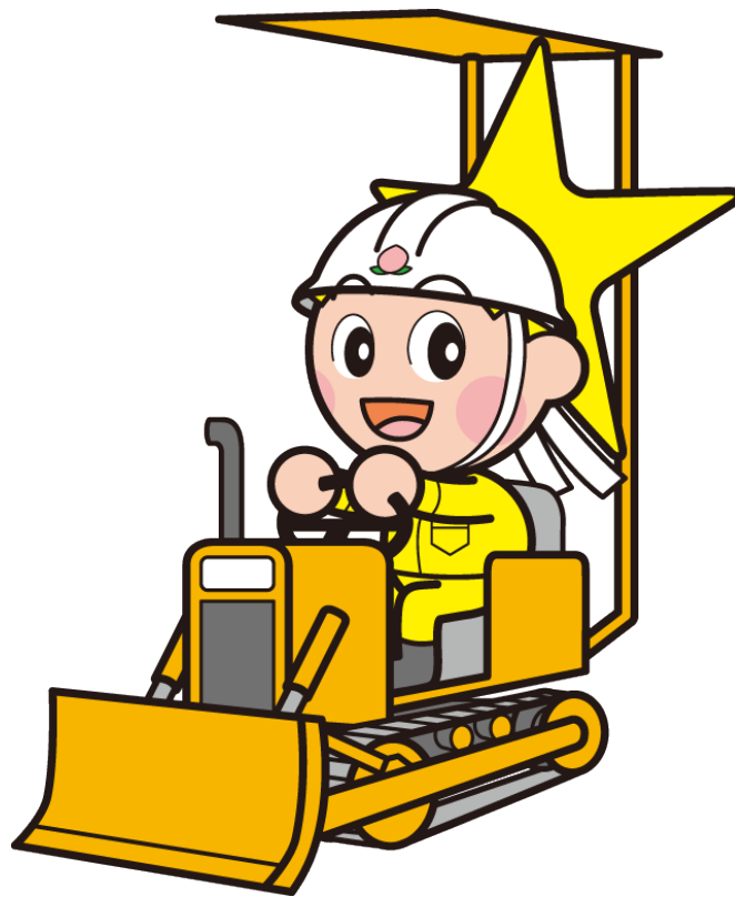
岡山県マスコット ももっち