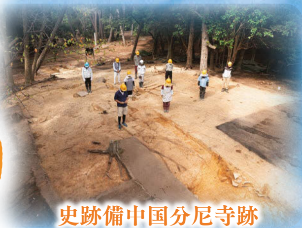
史跡備中国分尼寺跡