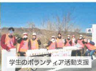
学生のボランティア活動支援