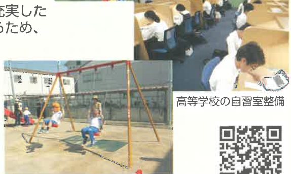
高等学校の自習室整備