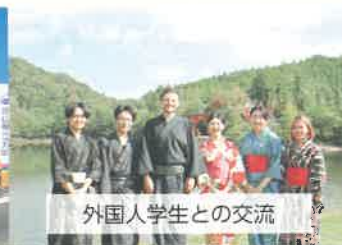
外国人学生との交流