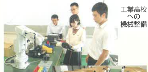
工業高校 への 機械整備