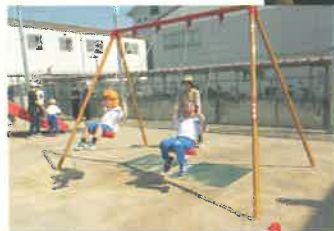
特別支援学校への遊具の設置