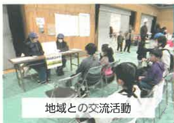
地域との交流活動