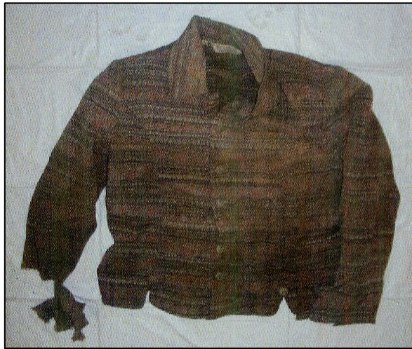
ピンク色厚手ブラウス