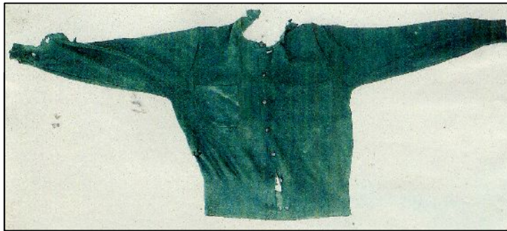
緑色カーディガン