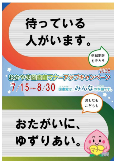
キャンペーンポスター