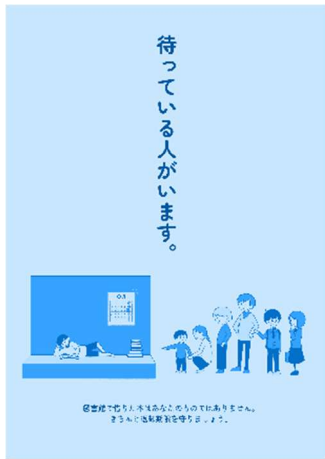
キャンペーンポスター