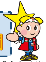
岡山県マスコット「ももち」