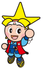
岡山県マスコット「ももち」