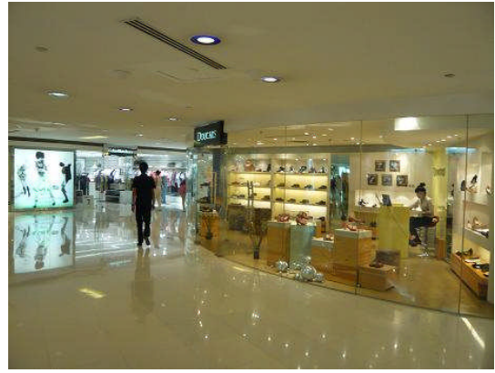
大連一の繁華街・青泥洼橋に立地する「百年城」