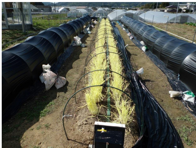
軟化途中の日入れ処理