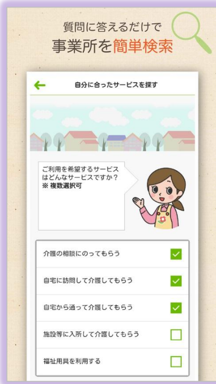
介護サービスに詳しくない方には質問形式で誘導