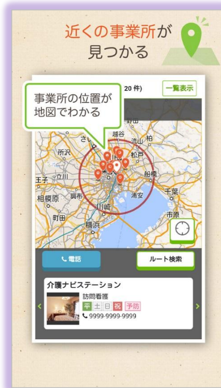
現在地からの距離や道順が分かる