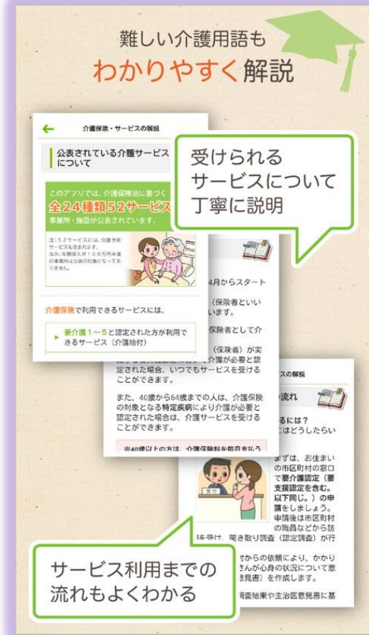
介護保険制度やサービスの利用手順等がイラストで解説