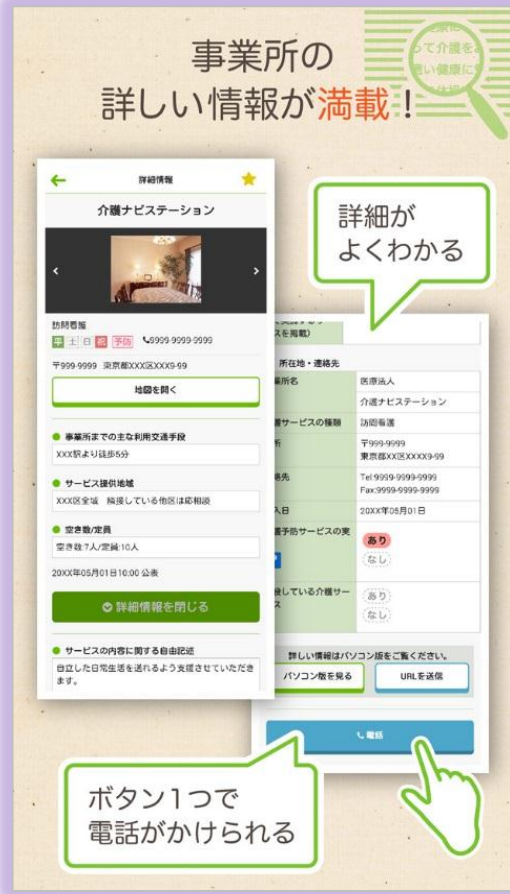
事業所の基本的な情報がコンパクトにまとまっている