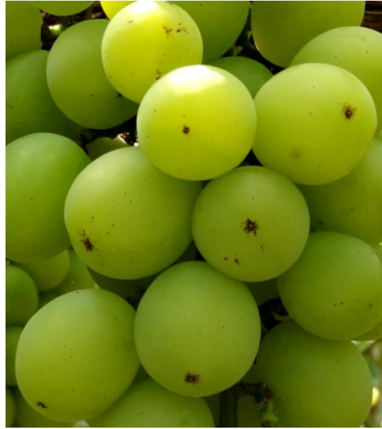
図3 ネギアザミウマの放虫により褐点病が発生した果房