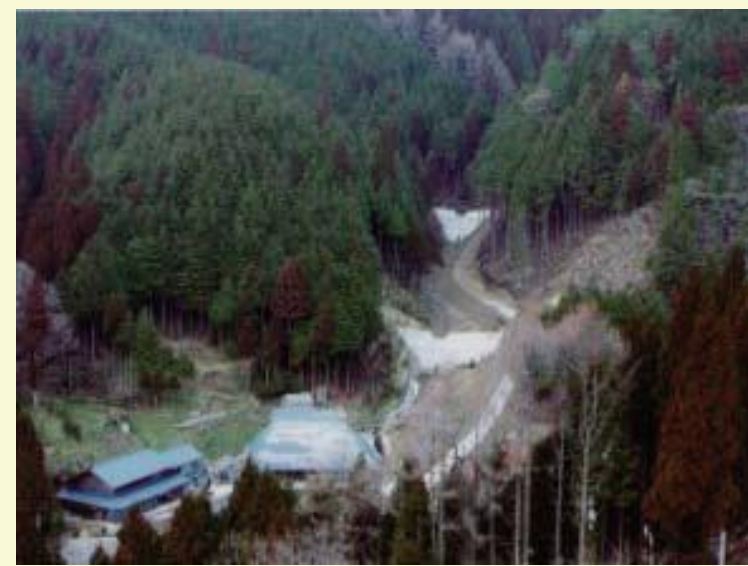
土砂流出による災害を未然に防ぐ治山ダム

近年、豪雨や地震などにより甚大な自然災害が各地で発生し、県民の生命・財産の喪失のみならず生活・経済に大きな影響を及ぼしていることから、森林分野においても、「緑の国土強靱化」を強力に推進し、地域の安全・安心を確保することが急務とされている。