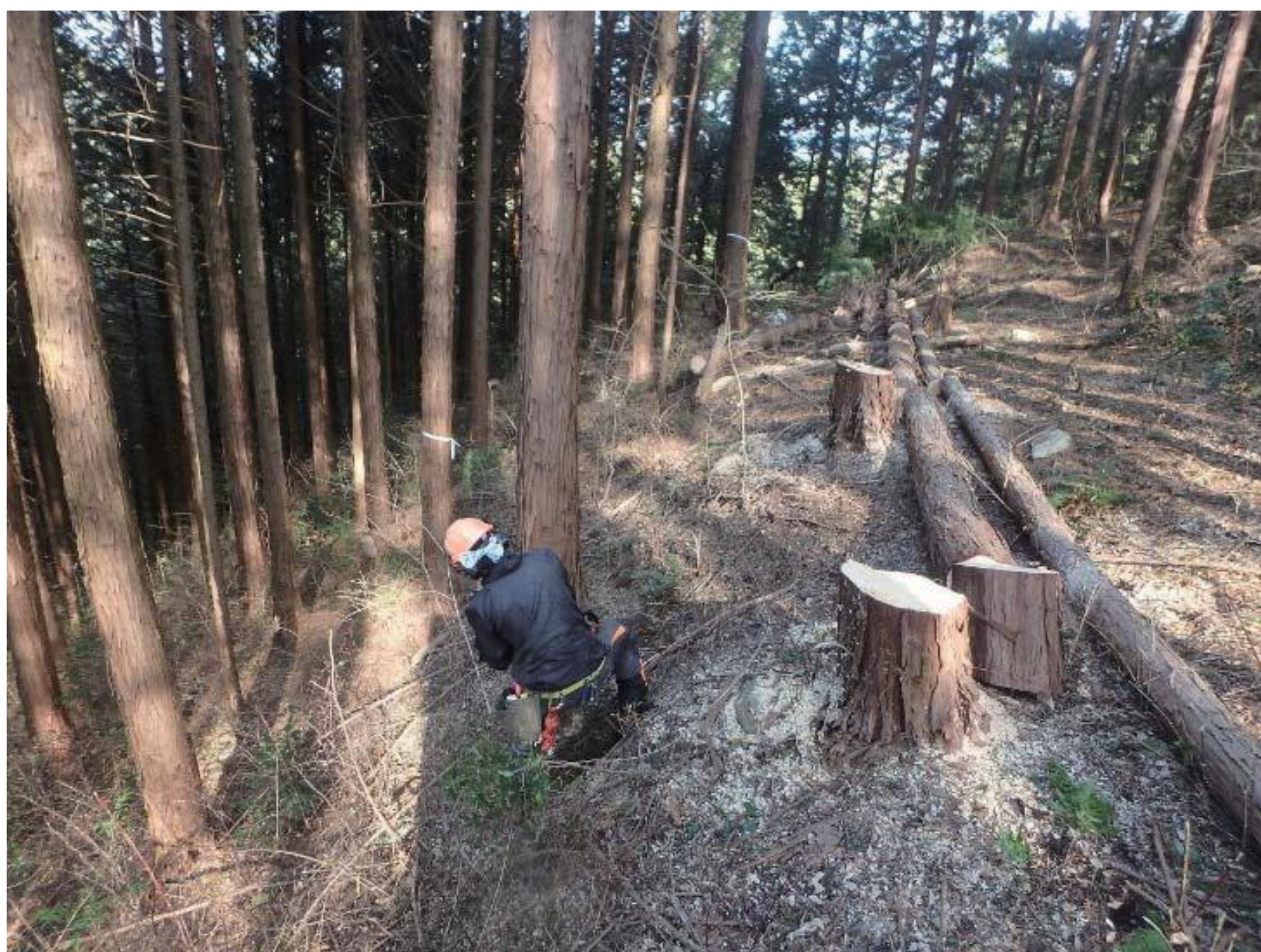
平成30年度間伐実施箇所 （吉備中央町下加茂地内）