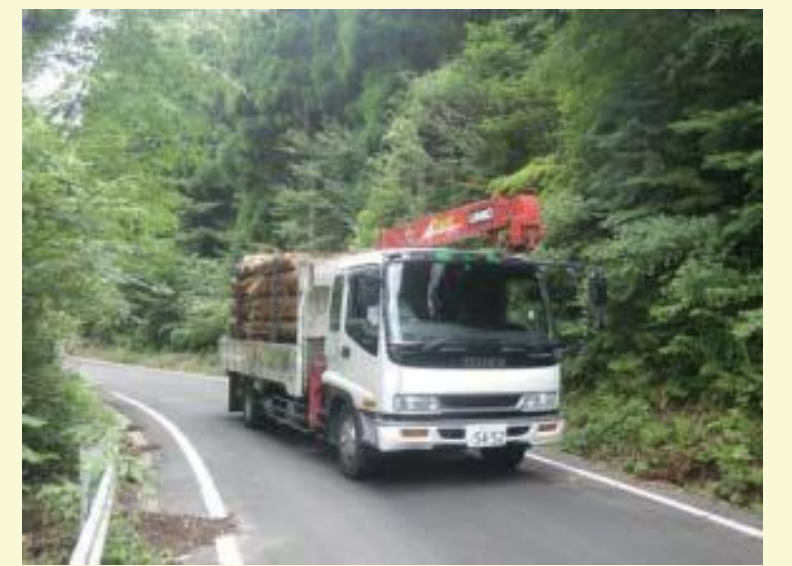
森林施業及び木材生産の基盤となる林道の整備