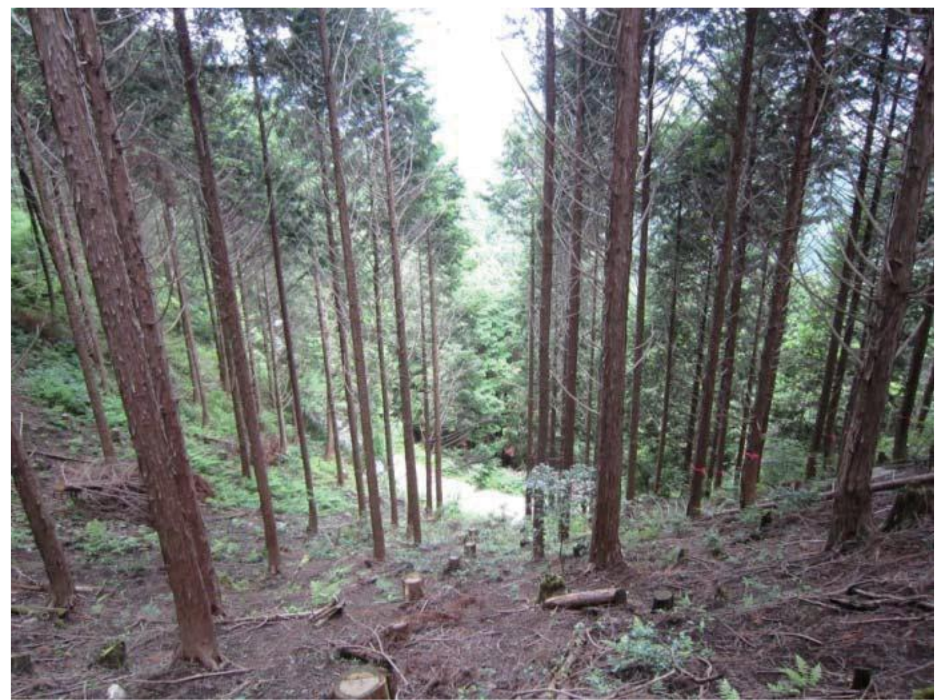
平成25年度間伐実施箇所 （津山市加茂町成安地内）