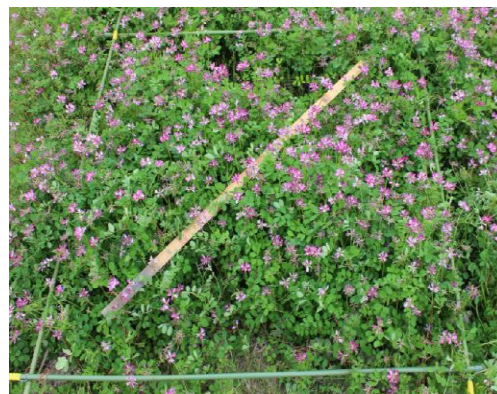
図2 レンゲの被度と草高の測定

注) 被度は1㎡中のレンゲ被覆割合を目視で判断し(図3を参照)、草高はレンゲ上に置いた竹製1m差しの地表高を別の物差しで測定する。