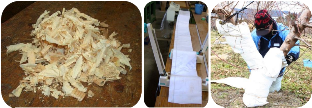
図1 新規保護資材に用いるヒノキのプレーナー屑（左）、透湿性防水シートの外袋（中）及びモモ樹への巻き付けの様子（右）