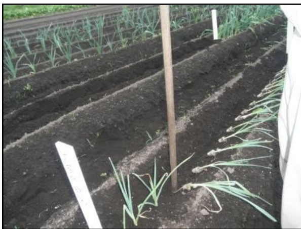
図2 本圃定植作業の様子（鍬の柄で10cm程度の植穴を空け埋め込む）