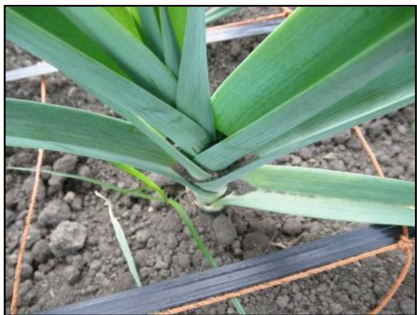
図3 土寄せ時の土の混入