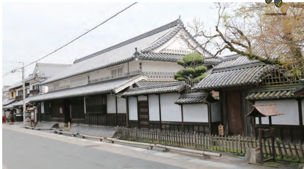
旧矢掛本陣石井家住宅

江戸時代の山陽道には50余りの宿駅があり、矢掛は宿駅に発達した宿場町の一つです。宿駅の主な役割は、幕府役人や公的な荷物・手紙を宿駅から宿駅へ継ぎ送ったり、参勤交代の大名に宿舎を提供したりすることで、それに伴って宿場町には大名などが宿泊する本陣や脇本陣が置かれました。