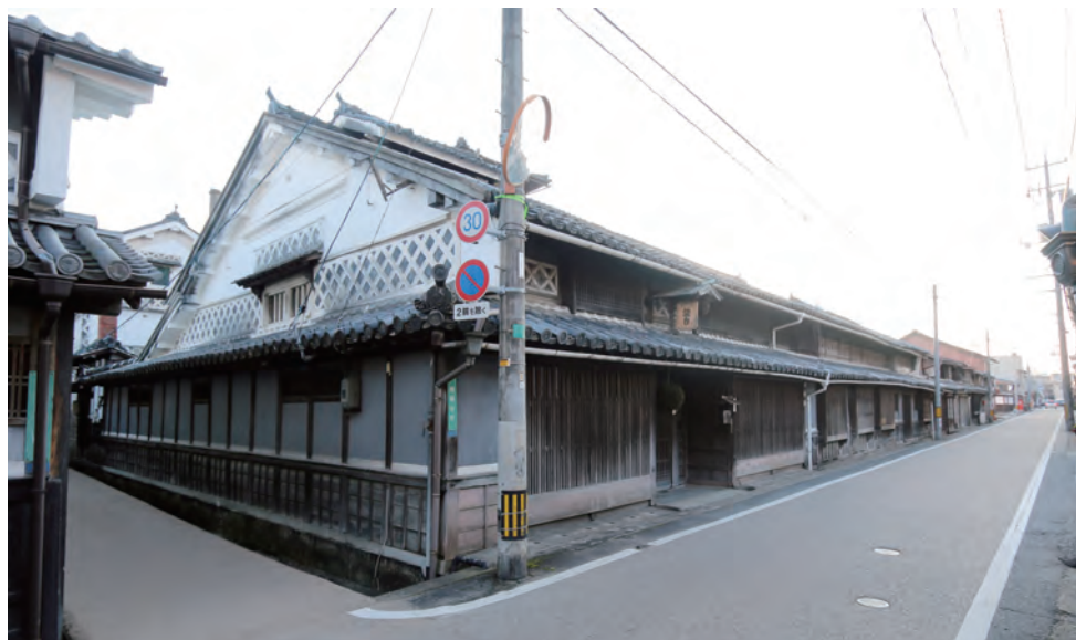
旧 荻 田 家 住 宅

造業を始めました。そのほか、伝建地区内では、幕末に活躍した洋学者・医師であった筑作阮甫 みづくりけんぽ の旧宅(国史跡)が公開されているほか、城東むかし町家(旧梶村家住宅 国登録有形文化財)や旧梶村氏庭園(国登録記念物)、津山ゆかりの洋学者の資料を展示している津山洋学資料館もあります。また、町家を復元整備した休憩所である作州城東屋敷のだんじり展示館では、津山だんじり(県指定重要有形民俗文化財)を見ることができます。