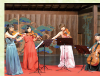
弦楽四重奏 (岡山フィルハーモニック管弦楽団)