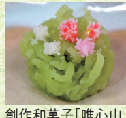
創作和菓子「唯心山」

創作和菓子とお茶で優雅なひとときをお過ごしください。 和菓子セット...500円(お菓子1種・お茶)/抹茶...300円