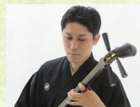
三味線演奏 (藤秋会 岡山支部)