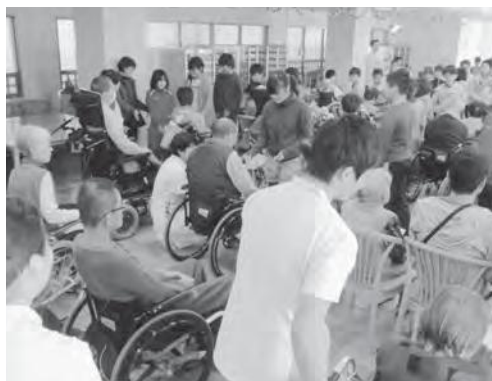
入院患者との交流

本校は、全校児童67名の小規模校です。20年前に吉備高原都市の中に建設された小学校です。本校の取組の概要を紹介します。