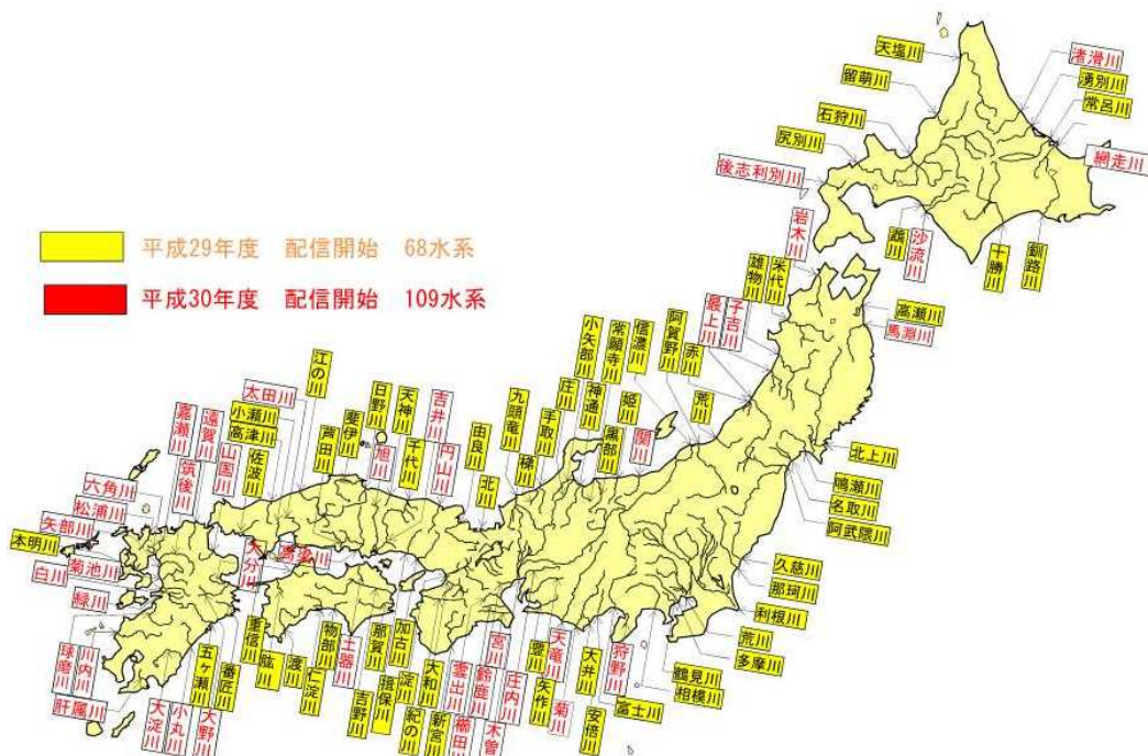
配信エリア拡大について