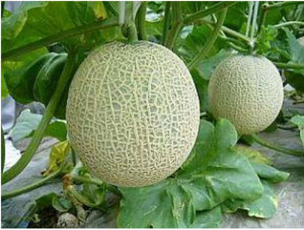
セルリーの収穫が終わるとメロンを栽培しています。山手のメロンは大きくボリューム感があります。