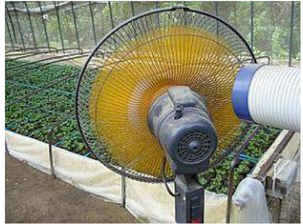
夏場の高温期の育苗では扇風機などを使っています。