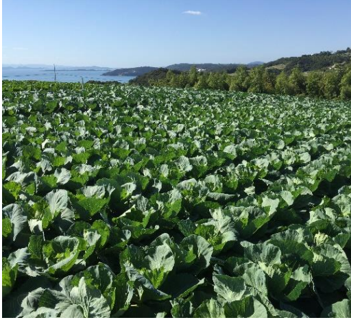
「牛窓甘藍」の栽培風景