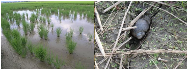
図1 ジャンボタニシの食害により 欠株が生じた水田

ジャンボタニシは、水田では土中に浅く潜り込んで越冬します（図2）。県南部地域で、このような貝がいる水田では、冬の防除を徹底してください。