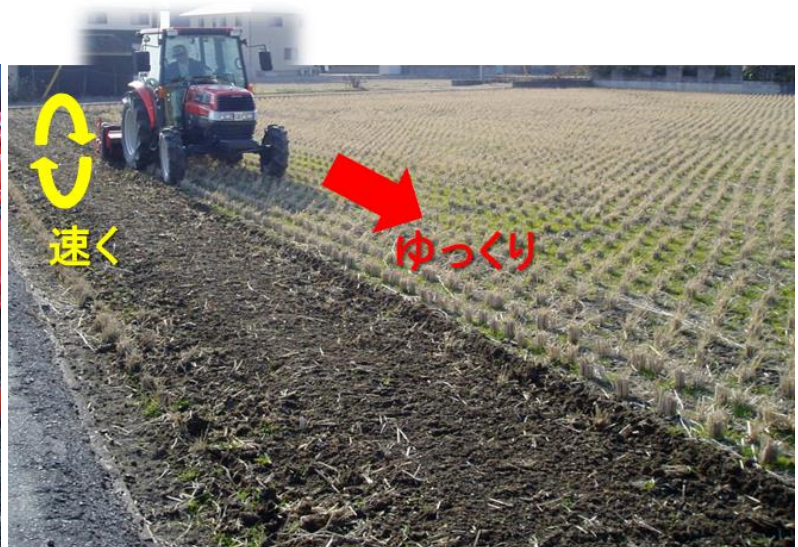
図5 厳寒期の水田の耕耘によるジャンボタニシの防除

この情報は、岡山県病害虫防除所ホームページでも公開しています。 アドレスは、 http://www.pref.okayama.jp/soshiki/239/ です。