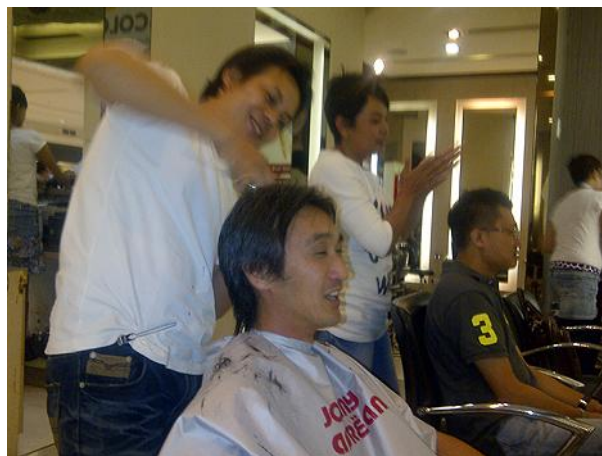
「JOHNNY ANDREAN」でカットしてもらう日本人

2001年より展開を始めた「KiddyCuts」は、インドネシアが豊かになってきている現状を象徴しています。カットができるのは子供のみで、椅子は電車やバスなどの遊具になっており、そこに子供を座らせ、髪の毛をカットしてくれます。店舗は高級ショッピングモールにしかなく、遊具に乗った我が子の写真を熱心に撮影する親の姿が見られます。