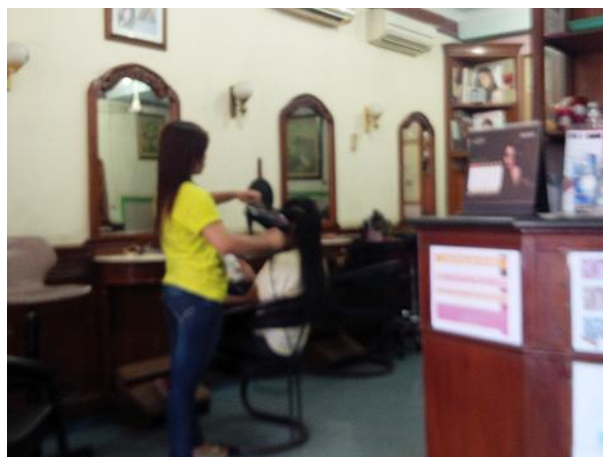
一般的な美容室(サロン)

「JOHNNY ANDREAN」は、美容師の養成学校も運営しており、養成学校に通う学生が練習も兼ね