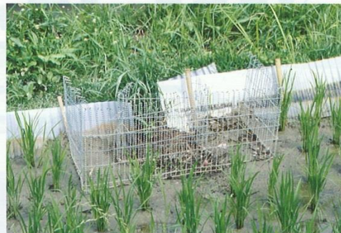
取水口に設置した金網

水田の取水口と排水口に金網(2cm以下の細かい目)を設置し、金網の外側にはゴミが詰まらないよう、目の粗い網を設置します。