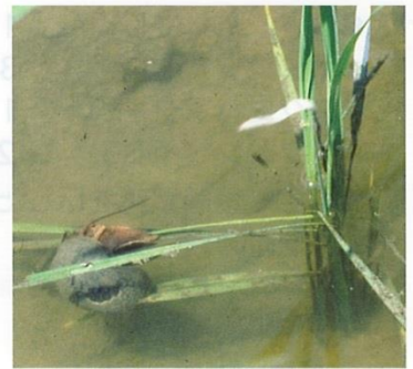
イネを食べるジャンボタニシ

乾田直播栽培では、イネが硬くなったのちに入水するので、被害は比較的問題になりません。