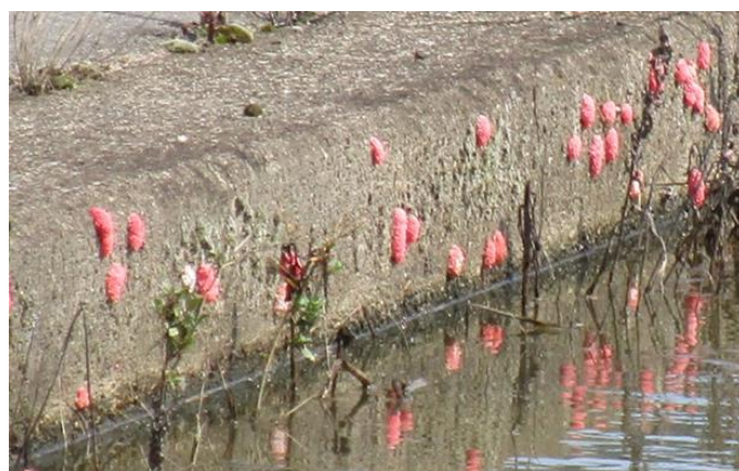
図2 用水路壁に産みつけられたジャンボタニシの卵塊