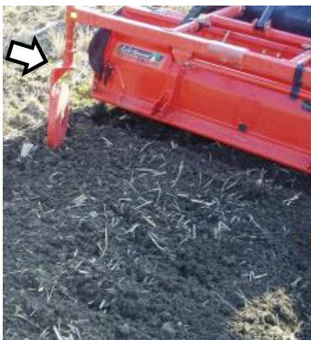
図4 尾輪の装着（矢印）