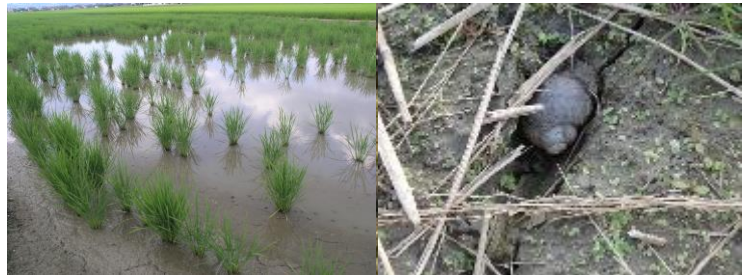
図1 ジャンボタニシの食害により 欠株が生じた水田

ジャンボタニシは、水田では土中に浅く潜り込んで越冬します（図2）。県南部地域で、このような貝がいる水田では、冬の防除を徹底してください。