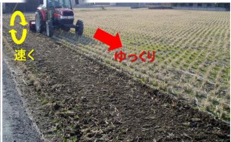
図5 厳寒期の水田の耕耘によるジャンボタニシの防除

この情報は、岡山県病害虫防除所ホームページでも公開しています。 アドレスは、 http://www.pref.okayama.jp/soshiki/239/ です。