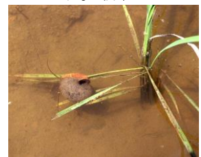
図3 イネを食害している ジャンボタニシ