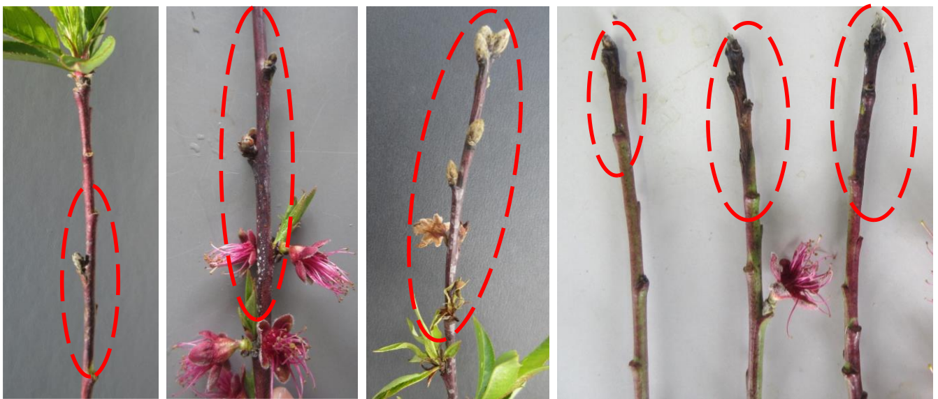
図2 春型枝病斑(囲み)