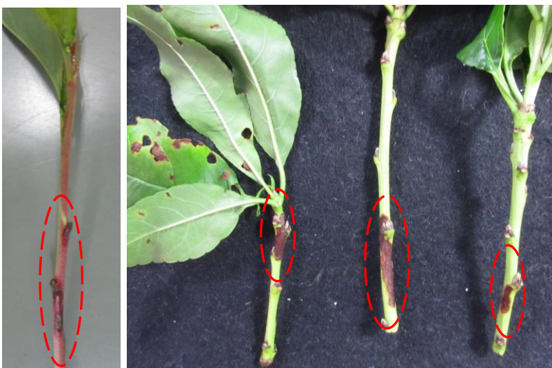
図3 夏型枝病斑(囲み)