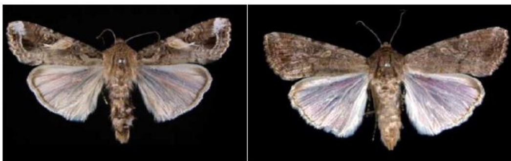
図1 ツマジロクサヨトウ雄成虫(左)と雌成虫(右) ※植物防疫所HPより

※ 農林水産省によると、本虫は、これまで国内で発生しているヨトウムシ類と同様、的確な防除の実施により被害の軽減が可能であると考えられている。