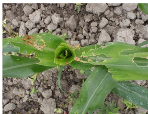
図3 飼料用トウモロコシの食害