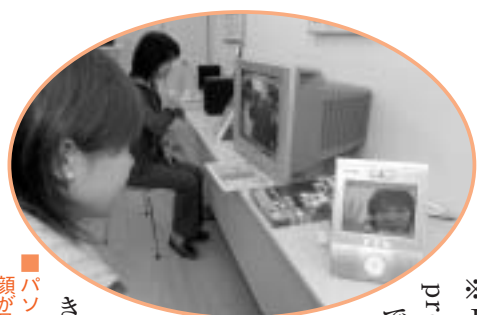
パソコンを使わず、話し相手の顔が見えるテレビ電話システム

愛称の「ゆびきたすくえあ」は、いつでも、どこでも、誰でも、インターネットを利用することができるという意味のユビキタスと、みんなが楽しく集う広場という意味の「スクエア」を組み合わせたものです。