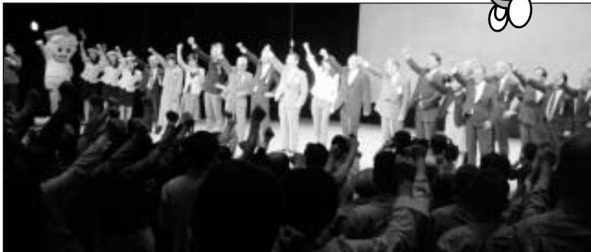
観衆も総立ちで「ガンパロー」コール

両大会のスローガン「あなたがキラリ☆」のとおり、参加する選手・監督、応援する人、ボランティアなど、両大会に関わるすべての方がキラリ☆と輝く大会となるよう、百九十五万岡山県民の総力をあげて、花いっぱい運動やクリーンアップ運動、おもてなし気運の醸成など、開催準備を着実に進めていきます。