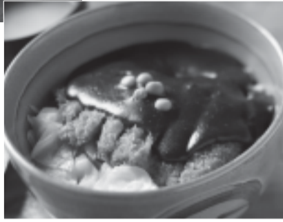
おかやまデミカツ丼