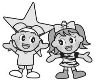
岡山県マスコット「ももっち」と「うらっち」

発行者：東京岡山県人会 〒102-0093 東京都千代田区平河町2-6-3 都道府県会館10階 岡山県東京事務所内 TEL. 03-5212-9080 FAX. 03-5212-9083