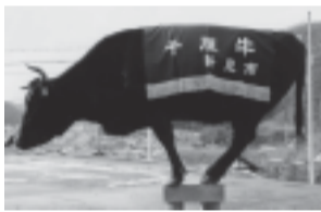
碁盤に乗る千屋牛

これらのほかにも、「おかやまデミカツ丼（岡山市）」や「美咲たまごかけごはん（美咲町）」など、地元の人に愛され続けている「ご当地グルメ」があります。