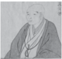
歙形蕙斎の肖像画