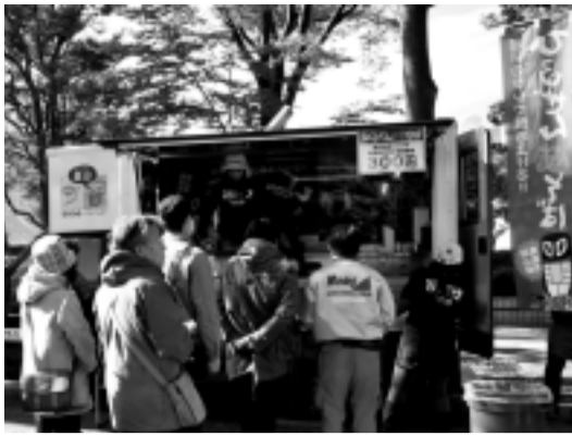
「ひるぜん焼そば」を販売するスイトンカー

今年も、北九州市で十月下旬に開催が予定されており、引き続き岡山県からの出展団体の活躍が期待されます。