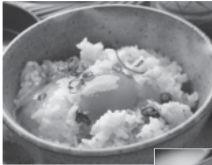
美咲たまごかけごはん

「美咲たまごかけごはん」は、「日本の棚田百選」に選ばれた「大井和西棚田」のある美咲町の棚田米を釜で炊いたご飯に、地元産の卵をかけた「たまごかけごはん」で、黄福（幸せを招く黄色と幸福のかけ合わせ）になると言われています。