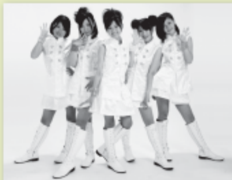
PR 天使のご当地アイドル SakuLove

本番の平成25年度事業については、これから続々と決定されていきますので、ご期待ください。