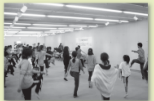
「みまさか猿神退治」オーディション風景

http://www.mimasaka1300.org/ 美作国建国1300年記念事業実行委員会事務局 Tel. 0868-35-3434