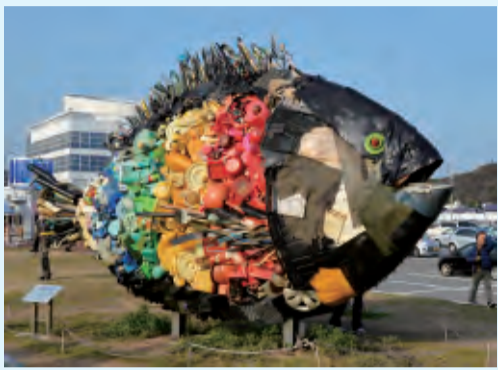
宇野のチヌ (淀川テクニック)

●玉野市は、今回から芸術祭に正式参加しています。宇野港には写真家荒木惟経氏(アラキキ)の巨大な写真(ビルボード)が登場。港には「チヌ」(写真)や巨大なプロペラのオブジェなどが点在しています。市では官民あげて「たまの☆おもてなし委員会」を設置し、来場者へのおもてなしに取り組んでいます。