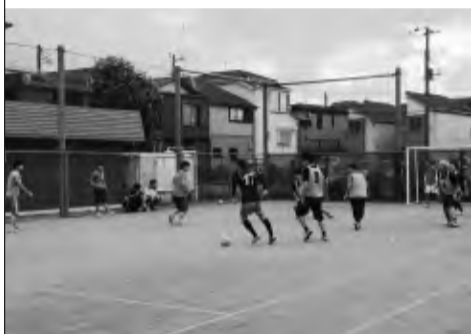
学生寮対抗フットサル大会