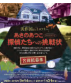
美作国 The ミステリー

その他、たくさんのイベントがあります。詳しくは、ホームページをご覧ください。 http://www.mimasakat1300.org/