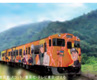
NARUTO-ナルト列車 (写真はイメージ)

さらに、九月十四日からは「美作国1300年記念事業」が始まります。美作市出身の小説家、あさのあつこ氏が美作地域を舞台に書き下ろした短編ミステリー推理小説を読み、実際にその舞台となった観光スポットを巡り、重要なヒントを発見しながら謎を解いていくものです。見事、謎を解き明かしたら、抽選で名探偵賞をプレゼント!