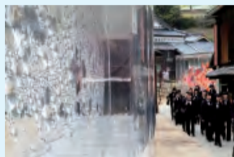
犬島の家プロジェクト A邸・S邸付近

発行者：東京岡山県人会 〒102-0093 東京都千代田区平河町 2-6-3 都道府県会館10階 岡山県東京事務所 内 TEL.03-5212-9080 FAX.03-5212-9083