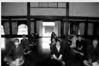
平成24年度岡山旅行（関谷学校での様子）