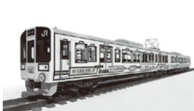
観光列車「ラ・マル・ド・ボァ」