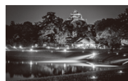
岡山後楽園「幻想庭園」

例年夏と秋に実施している岡山後楽園の「幻想庭園」と岡山城の「烏城灯源郷」を4月29日から約1か月間特別に実施します。春の夜に名園と名城が浮かび上がる情景がお楽しみいただけます。大原美術館では、女性に人気のmt(マスキングテープ)のアート企画展を開催します。駅や列車までmtのラッピングを予定しています。また、瀬戸内国際芸術祭の開催年でもあり、会場まで観光列車の運行も予定されています。さらに、日本遺産第一号の旧閑谷学校では、国宝の講堂で論語の朗読体験ができます。その他にも魅力ある企画が数多く用意されますので、是非この機会にふるさと岡山をお訪ねください。詳しい観光情報は、平成28年3月発行予定の公式ガイドブックで紹介いたします。「とっとり・おかやま新橋館」や最寄りのJR駅でお求めください。