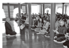
旧閑谷学校論語朗読体験