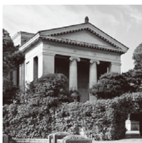
大原美術館 本館 外観

来年一月二十日から、六本木にある国立新美術館にて大原美術館の主要作がずらりと並び「はじまり、美の饗宴展—すばらしき大原美術館コレクション」が開催されます。同展