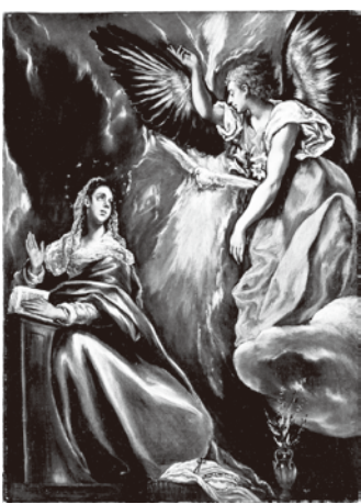
エルグレコ《受胎告知》

ばかり約百五十点が大挙して東京にやってきました。中でも注目なのが、館外への貸し出しが三十年ぶりとなるエル・グレコ《受胎告知》です。今から四百年近い昔、日本で