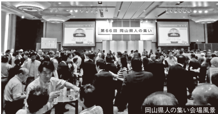
岡山県人の集い会場風景