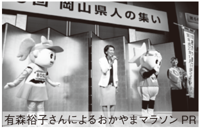
有森裕子さんによるおかやまマラソンPR