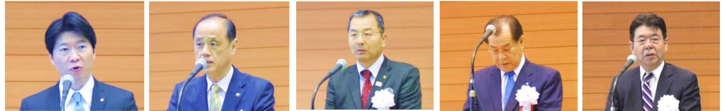
伊原木 岡山県知事