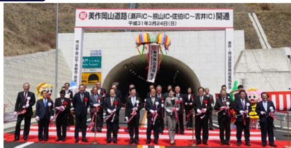
テープカット・くす玉開披